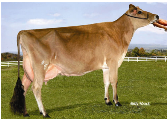
FAMILY HILL CONNECTION CHILLI GRANDDAM