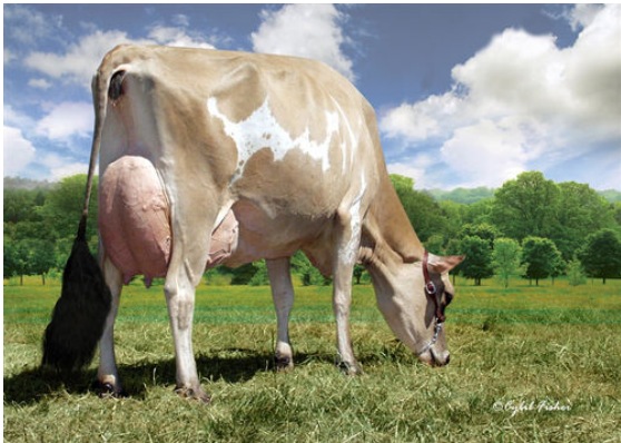
PLEASANT NOOK F PRIZE CIRCUS THIRD DAM