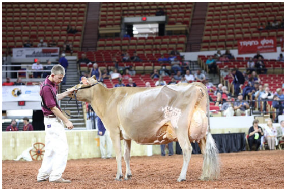
CHILLI NITRO CABO DAM